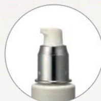
最後まで使える エアレスポンプ

エネルギーをチャージして肌(細胞)にアプローチ。役割が異なるさまざまな成分を、細胞の活動原理や肌の構造に基づいて配合しています。